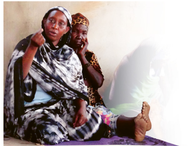
Flüchtlingsfrauen im Süden des Tschad. Jahrelang überlebten ihre Familien und sie dank der Hilfen von der Caritas. Inzwischen ernähren sie sich aus eigener Kraft.

Viehzucht im großen Stil und Erdölförderung haben den Bauern viel des ohnehin schon dicht besiedelten Landes genommen. Sie befürchteten, ihre Felder auf Dauer zu verlieren, wenn sie diese den "Rückkehrern" überließen. Die Kolleg_innen der Caritas Goré lösten das Problem: Sie vermittelten Pachtverträge zwischen Einheimischen und Flüchtlingen und sichern deren Einhaltung. Gegen Bezahlung pflügen die Bauern die verpachteten Felder mit. So entstanden Freundschaften. Die Familien bewirtschaften das Land gemeinsam und versorgen sich heute selbst.