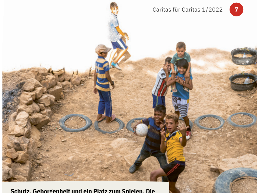
Schutz, Geborgenheit und ein Platz zum Spielen. Die Realität der Kinder von Nueva Alianza ist eine andere.

Fast zwei Millionen venezolanische Migranten sind in Kolumbien registriert. Mehr als die Hälfte von ihnen hat keinen geregelten Aufenthaltsstatus, somit keine Arbeitserlaubnis und keinen Schutz vor Ausbeutung und Gewalt. Die Grenzstadt Cúcuta hat etwa 780.000 Einwohner, darunter 95.000 registrierte venezolanische Migrantinnen