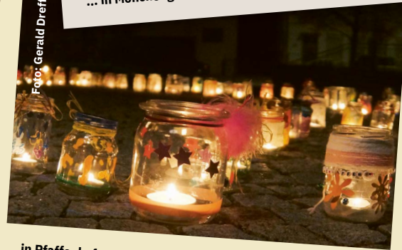
... in Pfaffenhofen