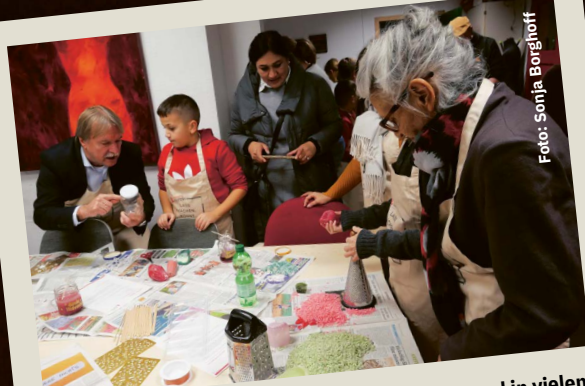
... in Krefeld mit den Gästen aus Tadschikistan und in vielen anderen Orten