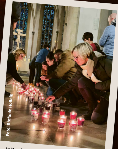
... in Bruchsal